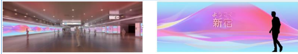
○環境演出イメージ