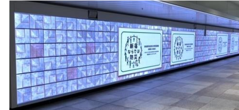
○JR業務情報・新宿区行政情報放映イメージ