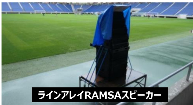
ラインアレイRAMSAスピーカー