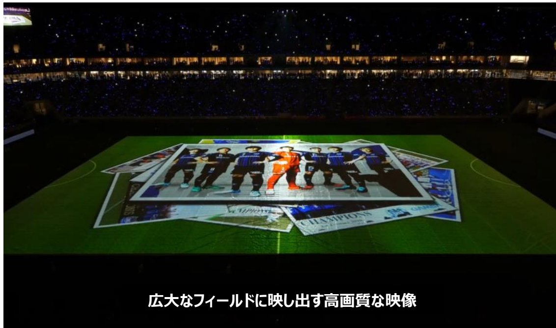
広大なフィールドに映し出す高画質な映像