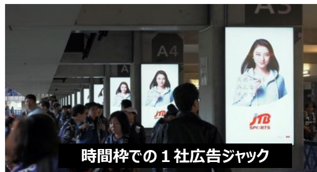
時間枠での1社広告ジャック