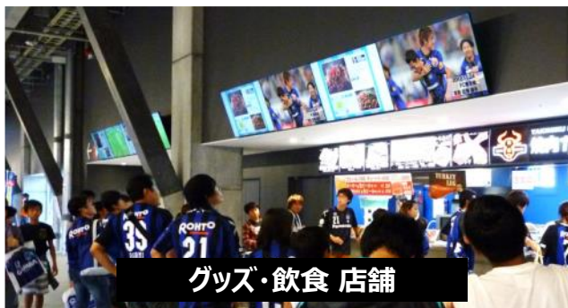
グッズ・飲食 店舗