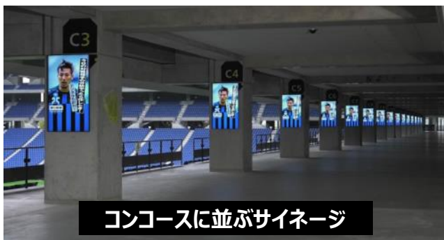
コンコースに並ぶサイネージ