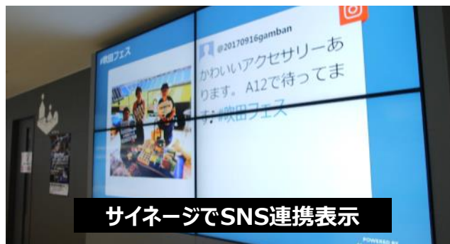
サインージでSNS連携表示