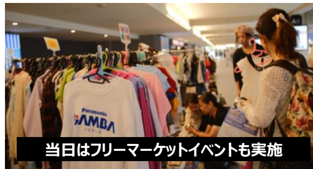
当日はフリーマーケットイベントも実施