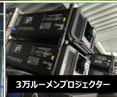
3万ルーメンプロジェクター