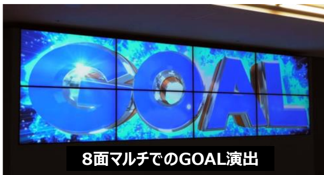
8面マルチでのGOAL演出