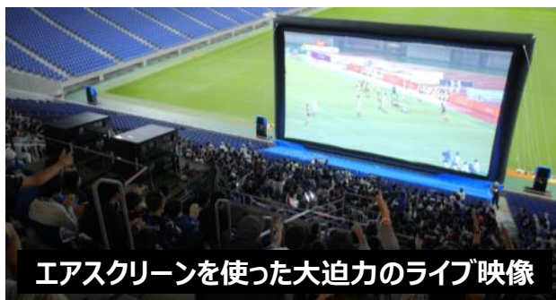
エアスクリーンを使った大迫力のライブ映像