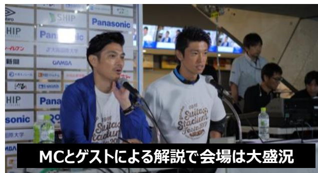
MCとゲストによる解説で会場は大盛況