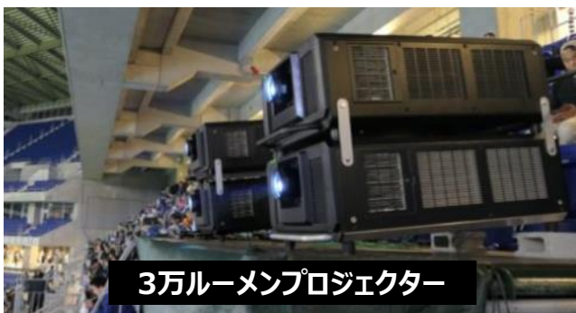
3万ルーメンプロジェクター