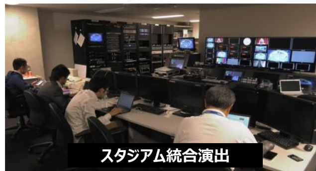
スタジアム統合演出