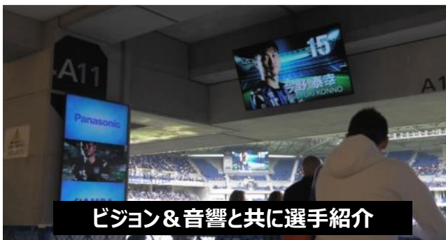
ビジョン&音響と共に選手紹介