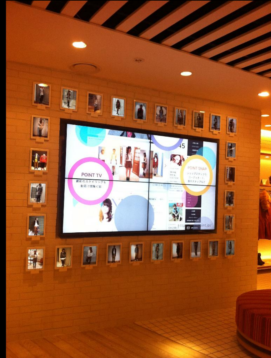
■ コレクトポイント 原宿店