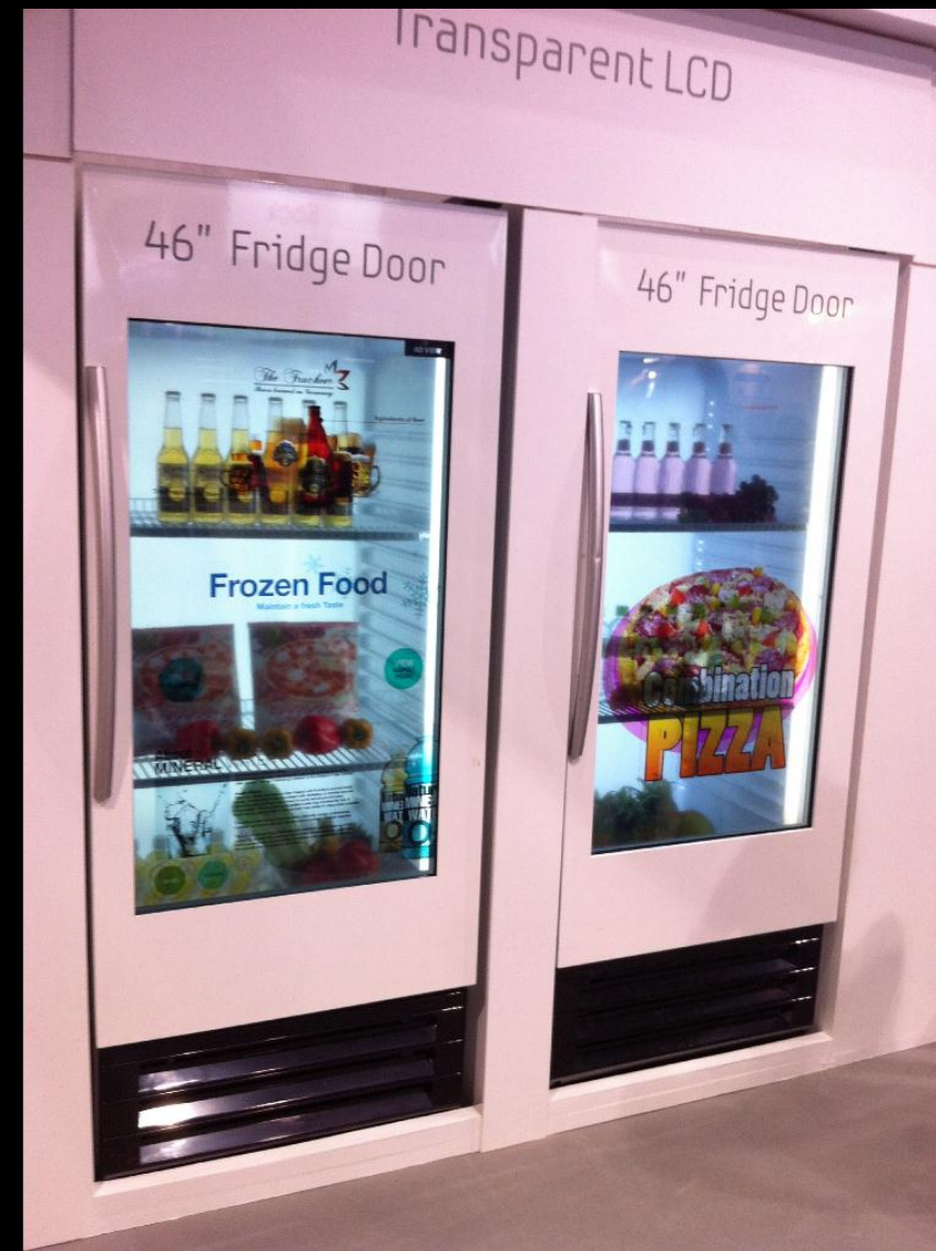
■ FPD international 2011より