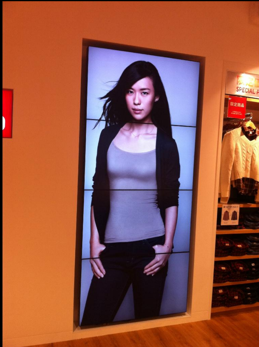
■ ユニクロ 池袋東武店