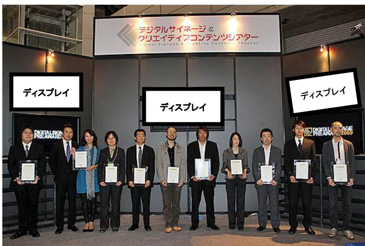
表彰時ディスプレイ(イメージ)