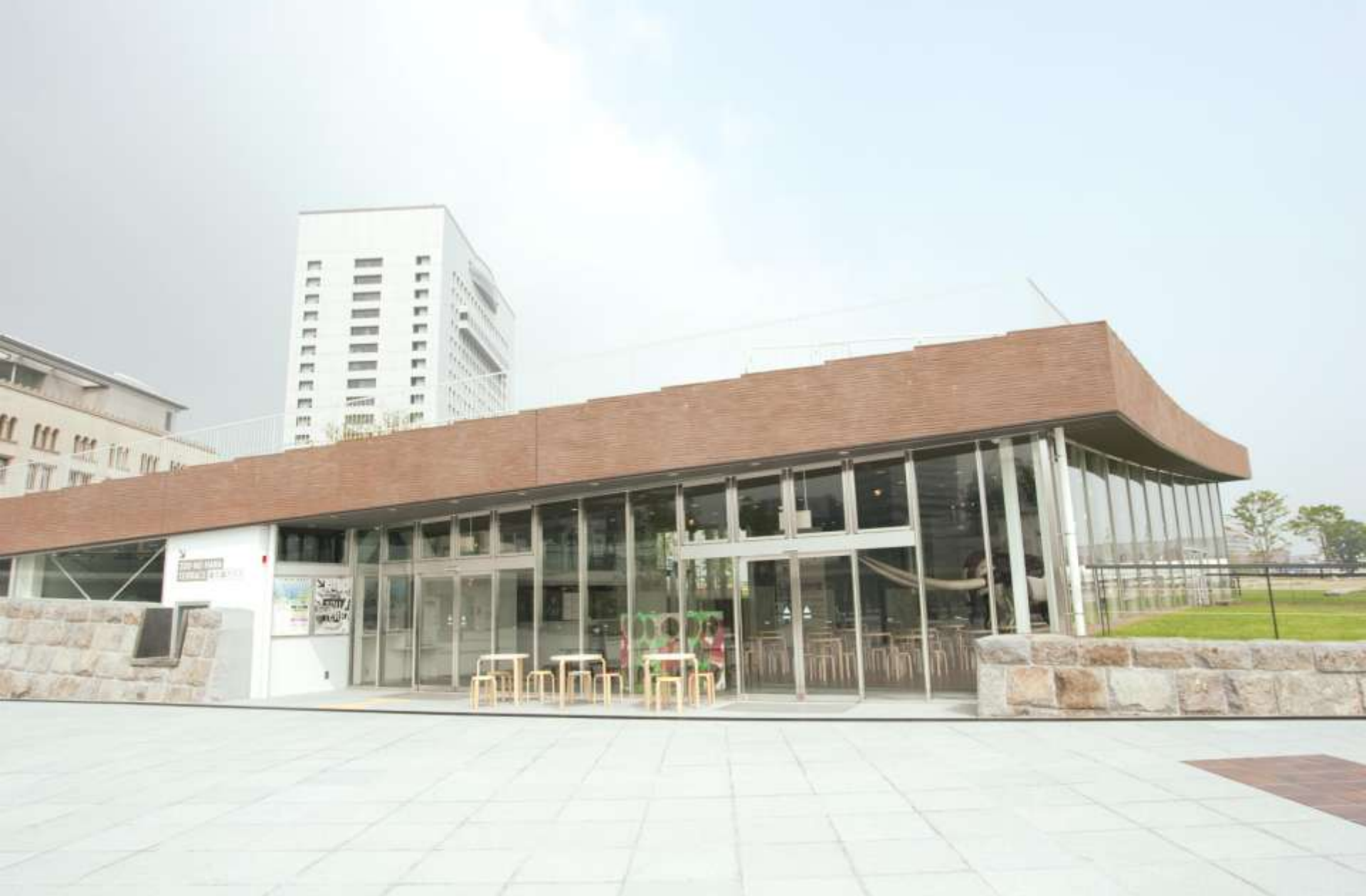
↓ ZOU-NO-HANA TERRACE 象の鼻テラス