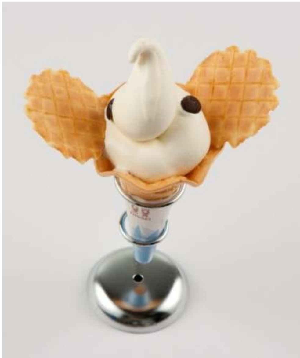
人気NO.1の「ゾウノハナソフトクリーム」