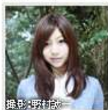
小泉麻耶 グラビアアイドル