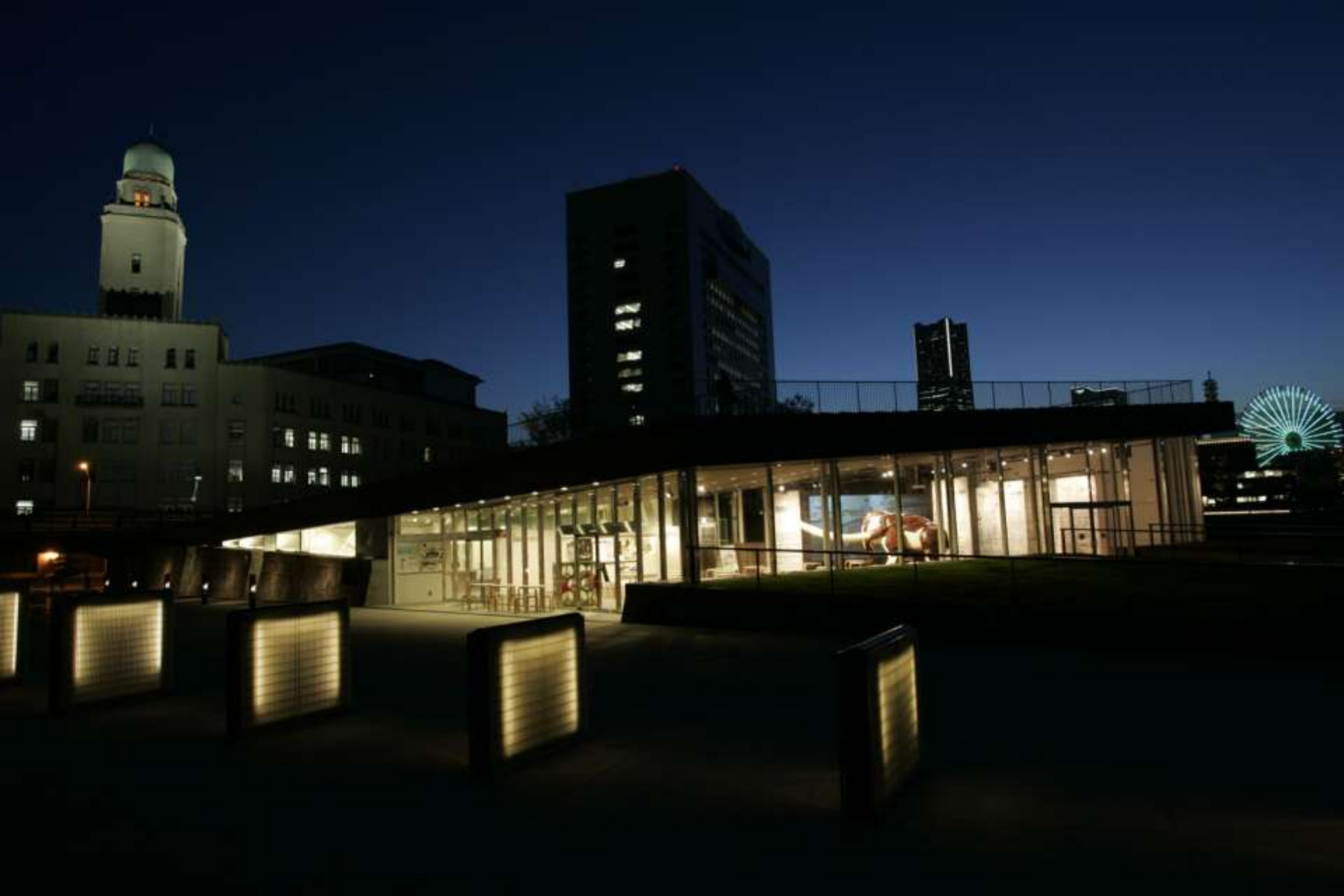
ZOU-NO-HANA TERRACE 象の鼻テラス