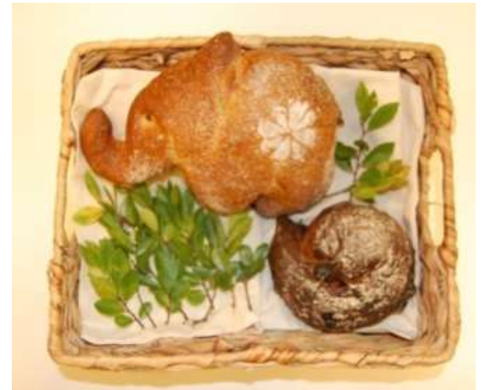
天然酵母のパン「ゾウパン」と「ゾウダンク」